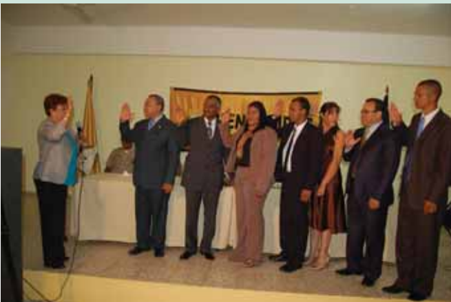
Acto de Juramentación en la provincia de San Juan de la Maguana.