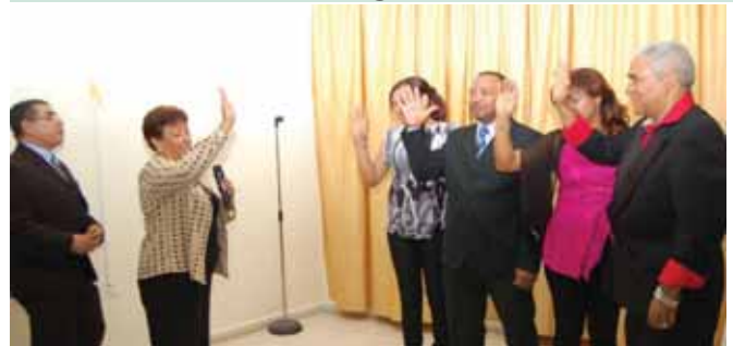
Acto de Juramentación en la Provincia de Azua