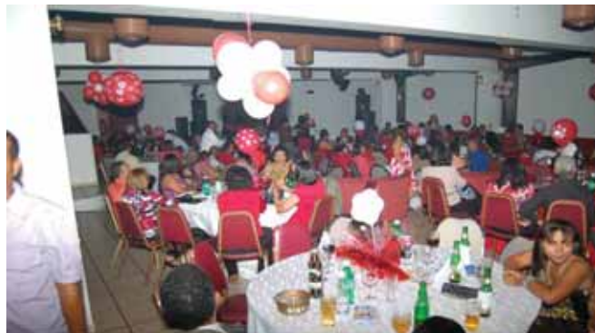
Público que acudió al festejo organizado por el CMD para sus agremiados y relacionados en el Día del Amor y la Amistad