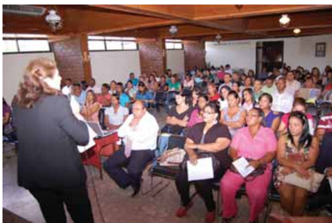
Curso de Aspirantes a Residencias Médicas