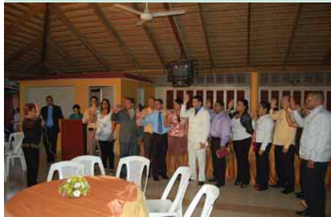
Grupo de médicos correspondientes a las provincias de Mao, Dajabón, Monte Cristi y Santiago Rodríguez, en Acto de Juramentación.