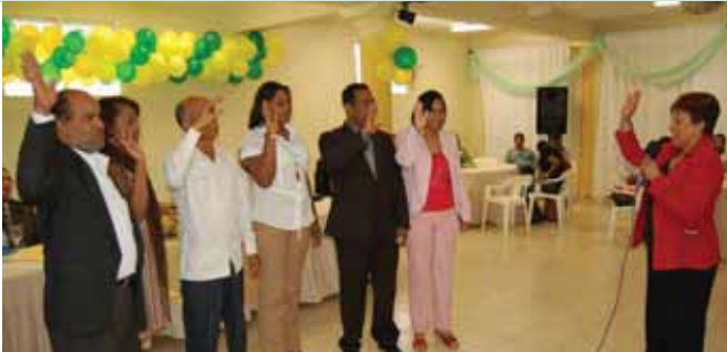
Nuevos líderes gremiales designados en la Filial de Elías Piña