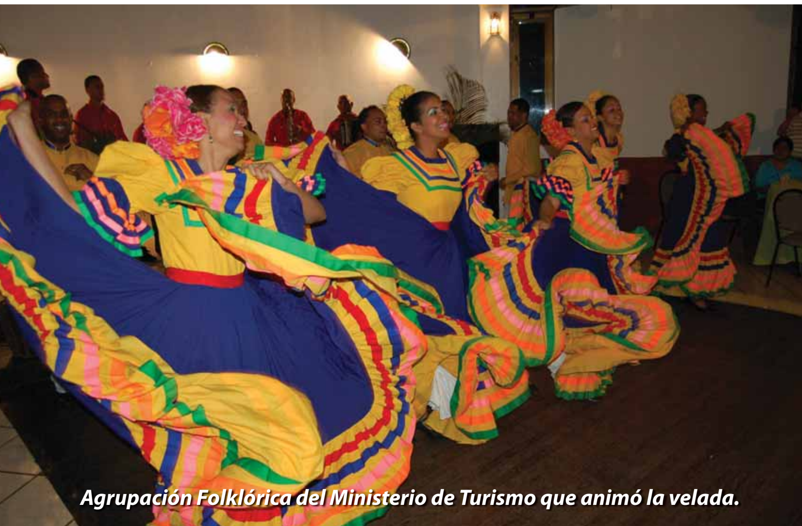
Agrupación Folklórica del Ministerio de Turismo que animó la velada.