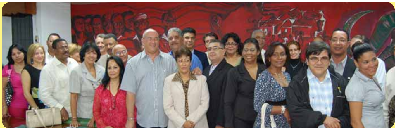
Delegación Hermanos Cooperativistas de Cuba, Honduras, Ecuador y Guatemala en visita de cortesía acompañados de los Miembros de la Junta Directiva Nacional