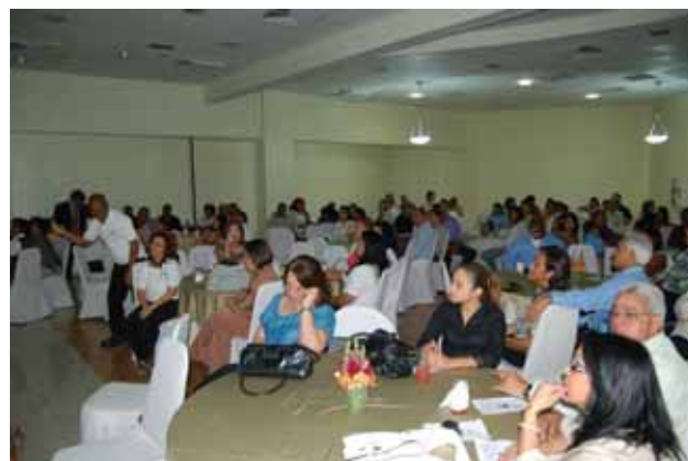
Público que asistió a la gremial y estuvo presente en la conferencia sobre los CAPS