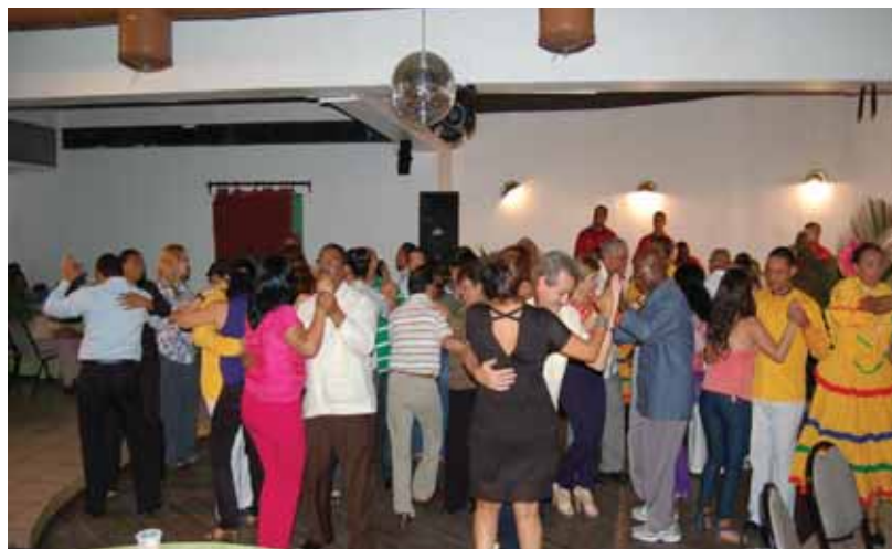
Delegación de Cuba, Honduras, Ecuador y Guatemala disfrutando de un contagioso merengue.