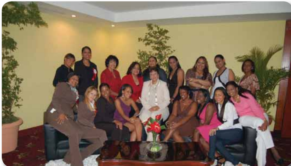
Staff de Secretarias CMD en almuerzo bailable con Eddy Herrera, organizado por Miembros de la Junta Directiva Nacional.