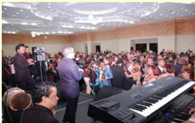
Muestra del conglomerado médic@ que bailó al ritmo de Héctor Acosta (El Torito).