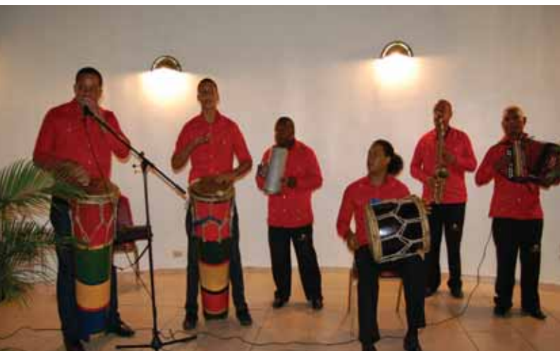
Conjunto Tipico del Ministerio de Turismo