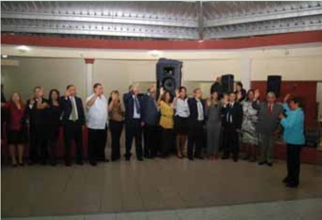
Acto de Juramentación llevado a cabo en Santiago de los Caballeros donde se designaron, además, los incumbentes de Puerto Plata, la Vega, Moca y Bonaño.