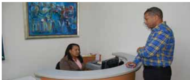
Area de caja general.