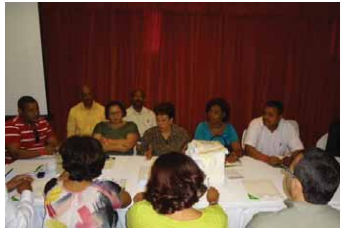
Mesa de trabajo liderada por la Presidenta y Miembros de la Junta Directiva en las discusiones del curso taller celebrado en Juan Dolio.