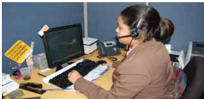
Uno de los cubículos Depto. Autorizaciones CMD.

Buscando reafirmar aun más los valores institucionales que posee, mantiene una política de puertas abiertas, de acercamiento con los usuarios y medios que permitan interactuar con su blanco de