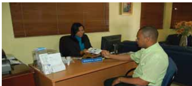
Area de servicio al cliente