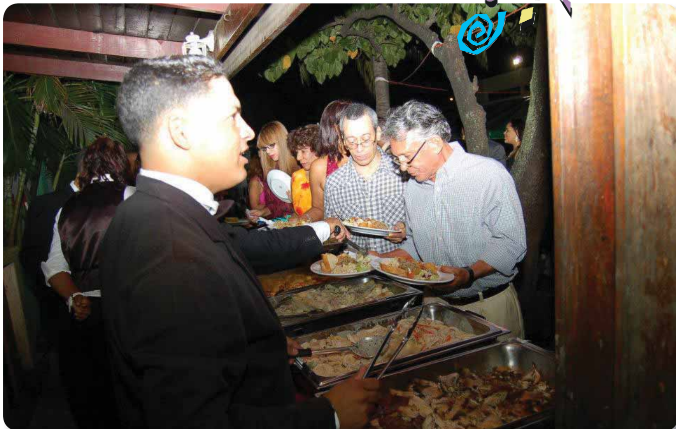
Rico y variado buffet navideño degustado por los médic@s en fiesta de fin de año.