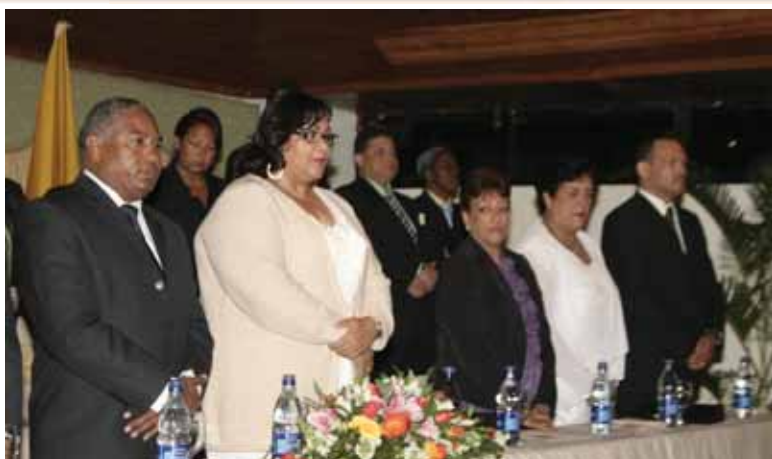
Mesa de Honor Acto Toma de Posesión Regional Distrito Nacional.