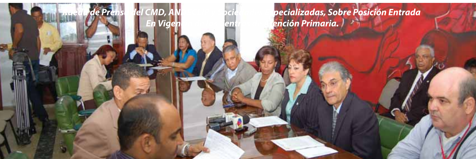
Rueda de Prensa del CMD, ANDECLIP y Sociedades Especializadas, Sobre Posición Entrada en Vigencia de la Ley de Atención Primaria.

Llamamos a nuestros médic@s generales, de medicina familiar y especialistas a que estén atentos a las directrices que se irán delineando en su Colegio Médico Dominicano.