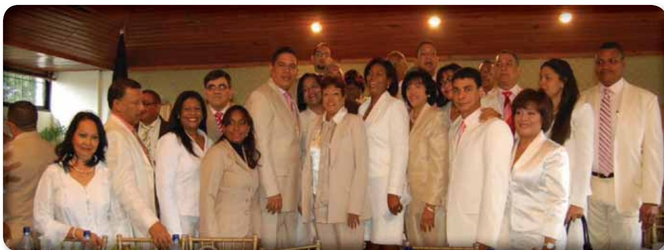
Miembros de la Junta Directiva Nacional luego de recibir Investidura en Acto de Toma de Posesión.

Luego de agotar una amplia agenda de juramentación de las directivas regionales y provinciales, así como de las distintas instancias que conforman parte de la estructura del CMD, como son: ARS-CMD, Planes Sociales y Responsabilidad Civil, inició una serie de acciones de concertación con diferentes sectores, dentro de las cuales se encuentra la visita al Ministerio de Salud Pública, donde se acordó con el Ministro de Salud, Dr. Bautista Rojas Gómez, desarrollar una agenda común destinada a enfrentar, de manera más efectiva, los problemas sanitarios del país; fruto de cambiar la confrontación por el diálogo permanente, entre ambas instituciones, incluyendo temas puntuales como: Atención Primaria, Residencias Médicas y Pasantía.