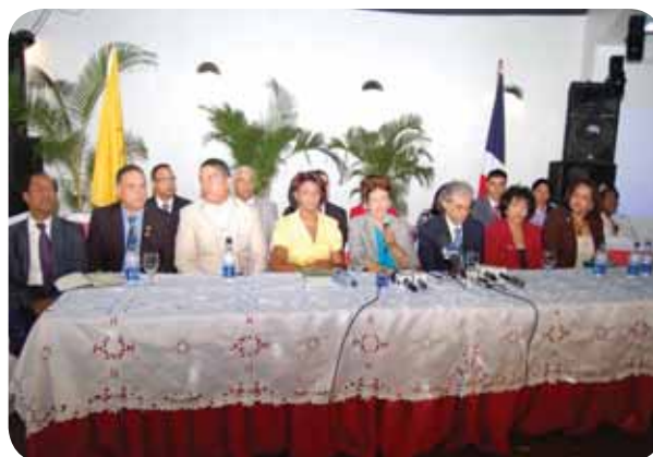
Acto de lanzamiento formal programa de televisión “CMD Orienta” con Miembros de la Junta Directiva Nacional en “Desayuno con la Prensa”.