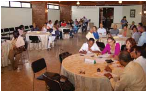
Mesas de trabajo que se conformaron en el "Taller Agenda Estratégica Secretariado de la Mujer"