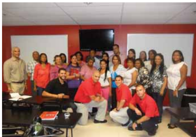
"Jornada de Reanimación Cardiopulmonar Avanzada e Interpretación Electrocardiográfica".