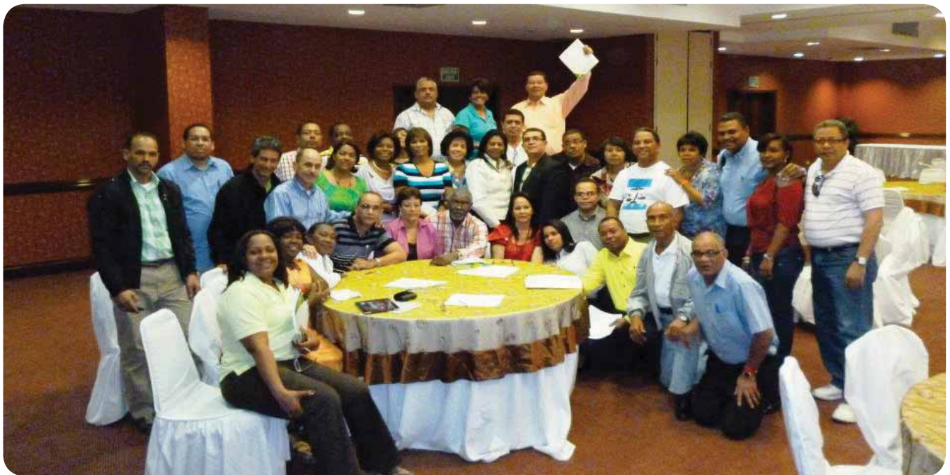
Vista Panorámica de los Médic@s que participaron en el Curso-Taller al cierre de dicha actividad