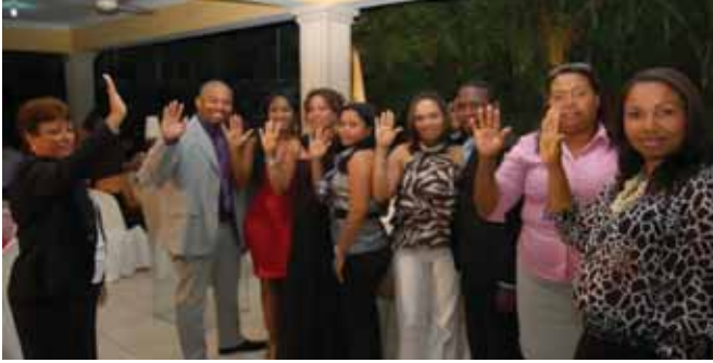
Juramentación Nueva Directiva de San Cristóbal y Baní.