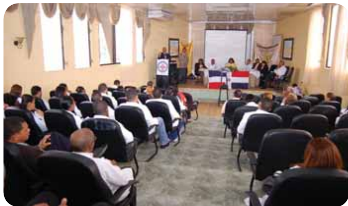
Conglomerado de especialistas que asistieron a la Jornada de Pacientes Politraumatizados: Ultimos Avances