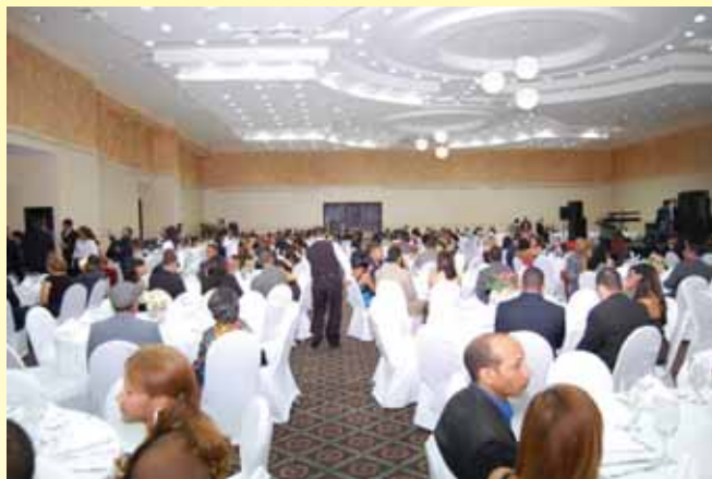
Invitados especiales que asistieron a la gran celebración.