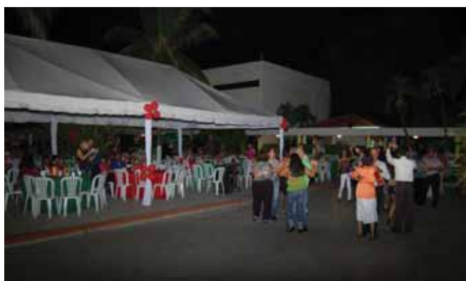
Ambiente bailable en "Fiesta de fin de Año CMD" en explanada de la piscina.