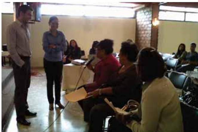
Jornada de Medicina Interna Últimos Avances