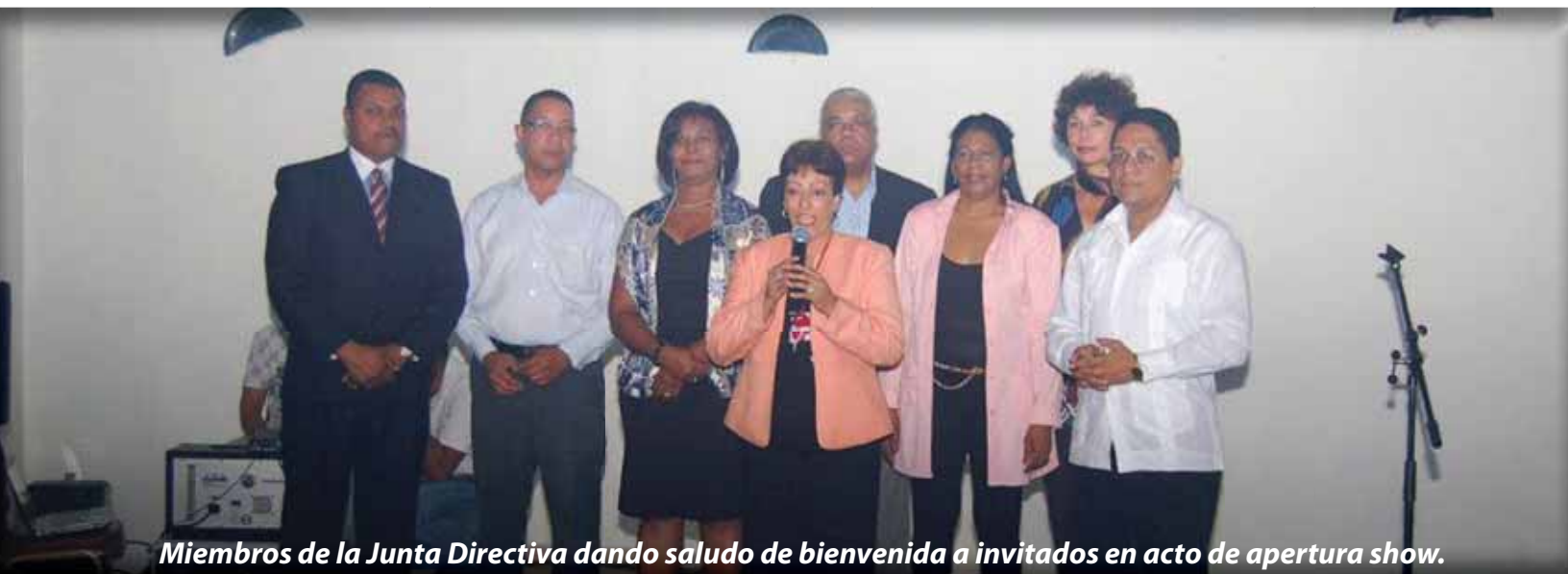
Miembros de la Junta Directiva dando saludo de bienvenida a invitados en acto de apertura show.