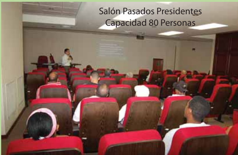
Salón Pasados Presidentes Capacidad 80 Personas