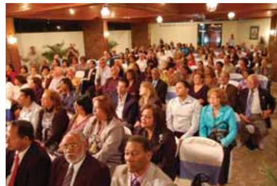
Invitados que dijeron presente en la "Noche de Gala Premiación Dra. Evangelina Rodríguez".