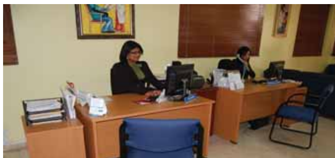
Area de recepción remozada.